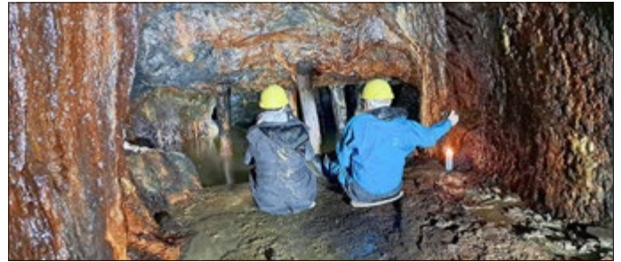
Sitzen und Verweilen am kleinen See!

Die abgestorbenen Fichten am Friedhof Schmiedefeld wurden von der Stadtverwaltung zur Fällung in Auftrag gegeben. Der Sturm 2024 hatte sie stark in Mitleidenschaft gezogen und Trockenheit und Borkenkäfer gaben ihnen den Rest. In der letzten Zeit stellten sie eine Gefahr für die Benutzer des Friedhofsweges und die Gäste des Friedhofes dar. Jetzt, nach der Fällung der Fichten, ist die Gefahr beseitigt.