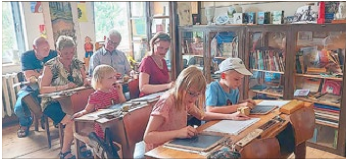
Schulzimmer im Rotschnabelnest