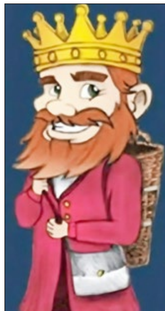
Unser König Morassin

Auf eine atemberaubende Reise durch unsere Morassina begibt man sich mit unserer Taschenlampenführung . Im Schein der Taschenlampe entdeckt man die vielfältigsten märchenhaften Gesteinsformationen und die Farbenpracht, die unser Tropfsteinkönig Morassin hinterlassen hat.