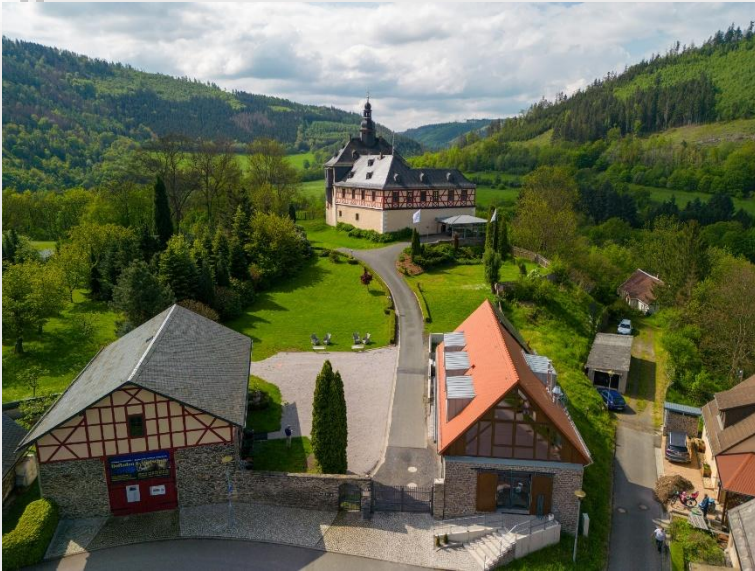
Ansicht des Schlosses Eichicht