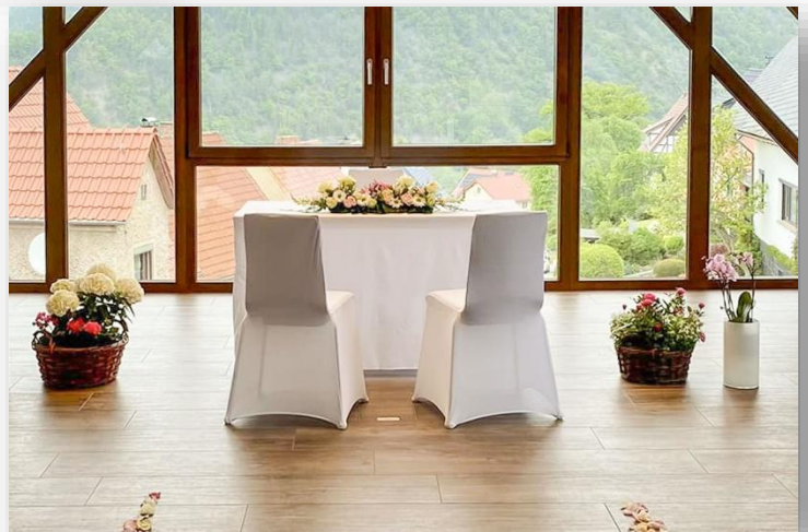
Traumzimmer im „wiederaufgebauten Scheunengebäude“

Bezüglich weiterer Möglichkeiten (Hochzeitsfeier, Musik, Sektempfang etc.) wenden Sie sich bitte vorab an die Eigentümer des Schloss Eichicht unter folgendem Link: