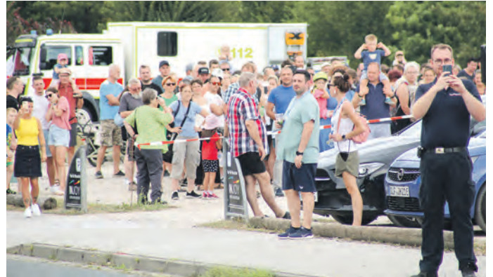
Große Resonanz bei den Besuchern fand die Darstellung der Rettungsmaßnahmen bei einem Unfall.

Erlebnisgelände entlang der Hugo-Trinckler-Straße