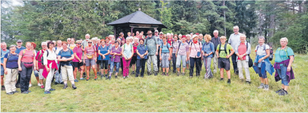
Die sechste gemeinsame Lutherwanderung führte in diesem Jahr am 31. August von Niederwillingen im Ilmkreis nach Paulinzella, das in diesem Jahr wegen des Jubiläums 900 Jahre Klosterweihe das ganze Jahr über im Mittelpunkt steht.