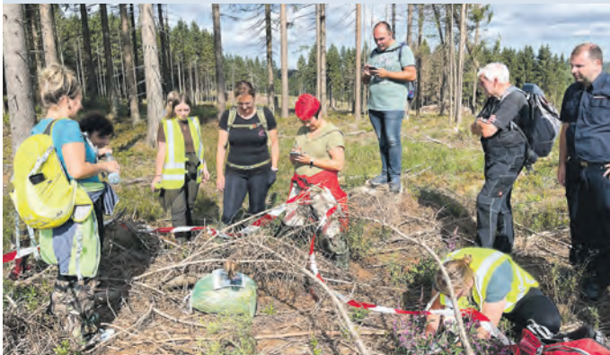
Die Fundstücke mussten dokumentiert und an die Einsatzleitung gemeldet werden.