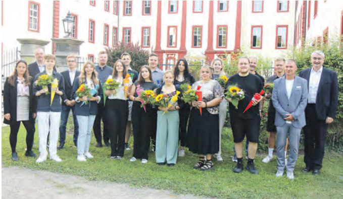
Die 14 anwesenden neuen Auszubildenden des Landratsamtes an ihrem ersten Arbeitstag nach der Begrüßung durch den Landrat.

16 Auszubildende in fünf Ausbildungsrichtungen