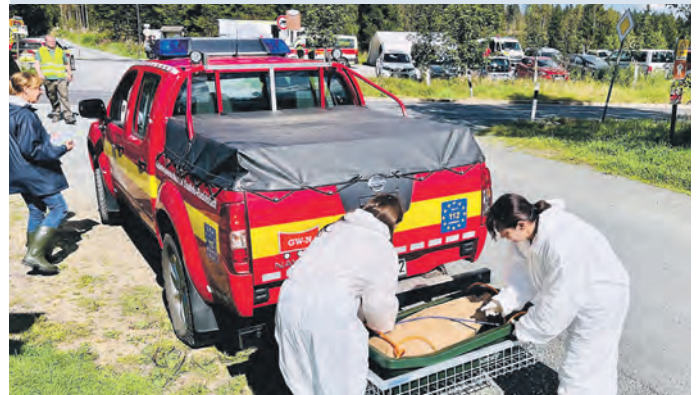
Anschließend rückten Bergungsteams an, um die „Kadaver“ fachgerecht zu entsorgen.