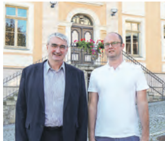
Vor dem Gräfenhaler Rathaus.

Eine Herzensangelegenheit ist dem Bürgermeister die Sanierung des Freibades in der Stadt. Hier wurden gemeinsam Fördermöglichkeiten erörtert. Zunächst soll eine Analyse des baulichen