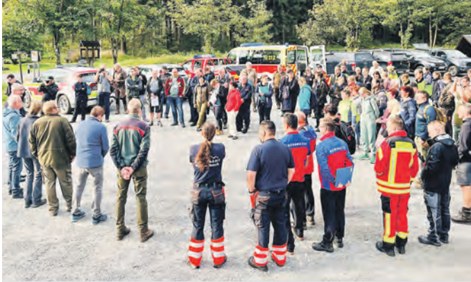
Auf dem Wanderparkplatz erfolgte die Einweisung der Einsatzkräfte.