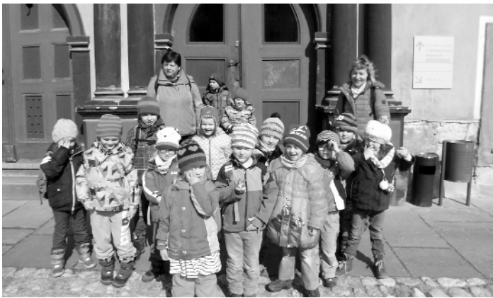
Kita Kleingeschwenda – Ausflug zur Heidecksburg nach Rudolstadt