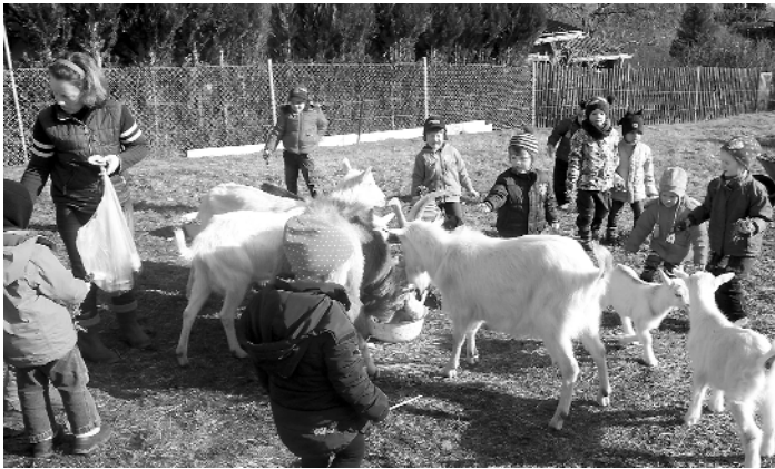
Kita Unterwirschbach – Ausflug zu den Ziegen