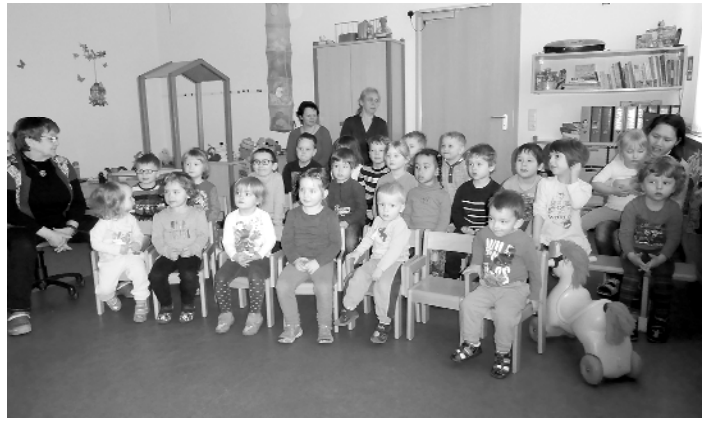
Kita Unterwirschbach – die Marionettenbühne ist zu Besuch