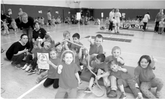
Kita Kleingeschwenda – Teilnahme am Käfersportfest