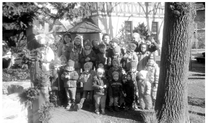
Kita Unterwirschbach – Spaziergang zum Osterbrunnen