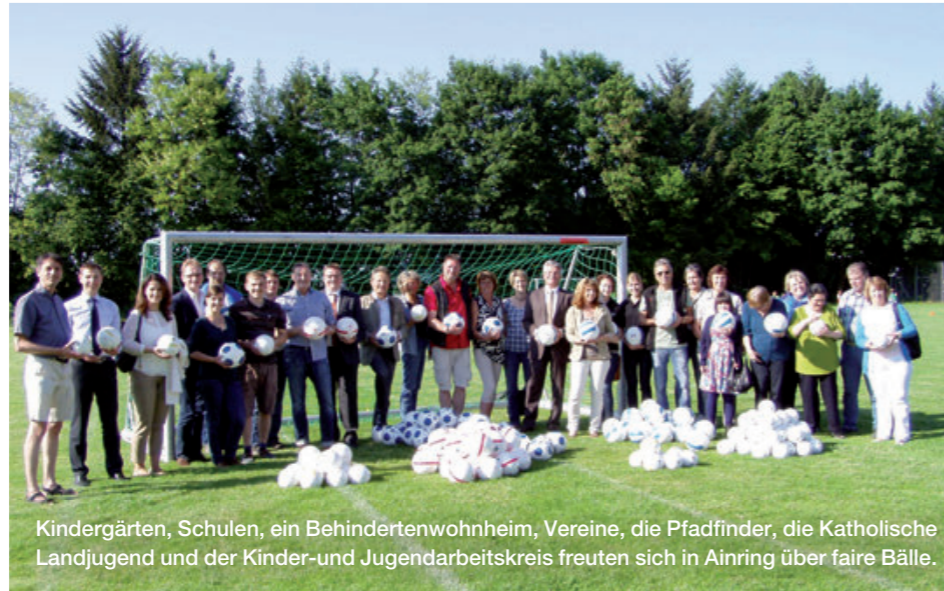
Kindergärten, Schulen, ein Behindertenwohnheim, Vereine, die Pfadfinder, die Katholische Landjugend und der Kinder- und Jugendarbeitskreis freuten sich in Ainingring über faire Bälle.