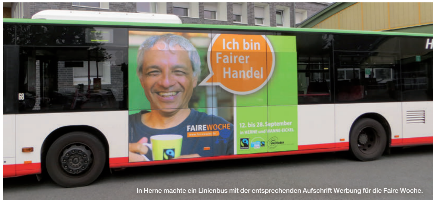
In Herne machte ein Linienbus mit der entsprechenden Aufschrift Werbung für die Faire Woche.