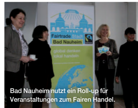
Bad Nauheim nutzt ein Roll-up für Veranstaltungen zum Fairen Handel.

Neubürger- und Veranstaltungsbroschüren (z. B. zur Fairen Woche in Bonn) sowie Tourismusinformationen eignen sich ebenfalls gut dafür, um über die Fairtrade-Towns-Auszeichnung und das Engagement der Stadt oder Region zu informieren.