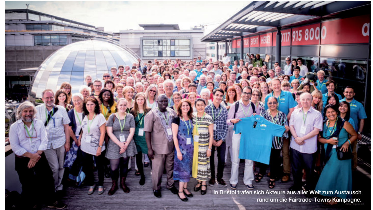
In Bristol trafen sich Akteure aus aller Welt zum Austausch rund um die Fairtrade-Towns Kampagne.