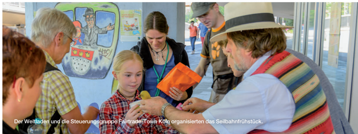
Der Weltladen und die Steuerungsgruppe Fairtrade-Town Köln organisierten das Seilbahnfrühstück.