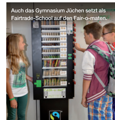
Auch das Gymnasium Jüchen setzt als Fairtrade-School auf den Fair-o-maten.

Snackautomaten ausschließlich mit Produkten aus Fairem Handel und entsprechender Auszeichnung stehen beispielsweise im Jugendamt der Stadt Castrop-Rauxel und im Rathaus der Stadt Wesel.