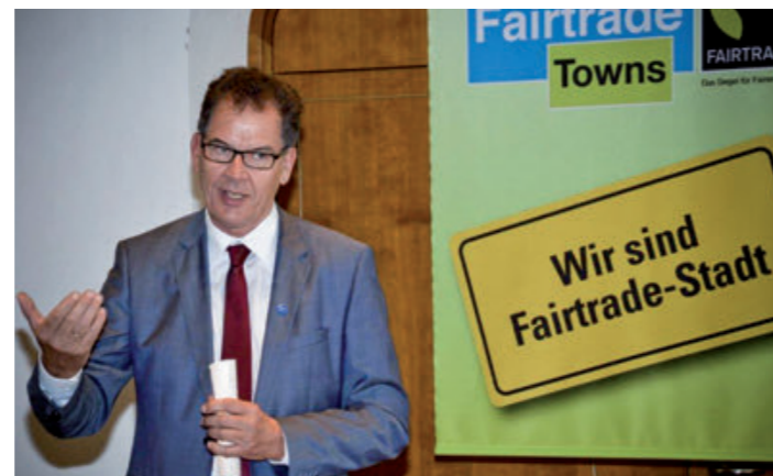
Auszeichnungsfeier in der Fairtrade-Stadt Kempten.