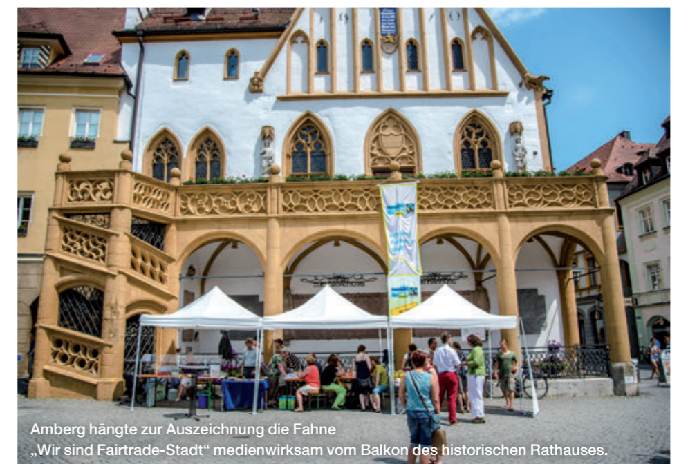
Amberg hängt zur Auszeichnung die Fahne „Wir sind Fairtrade-Stadt“ medienwirksam vom Balkon des historischen Rathauses.