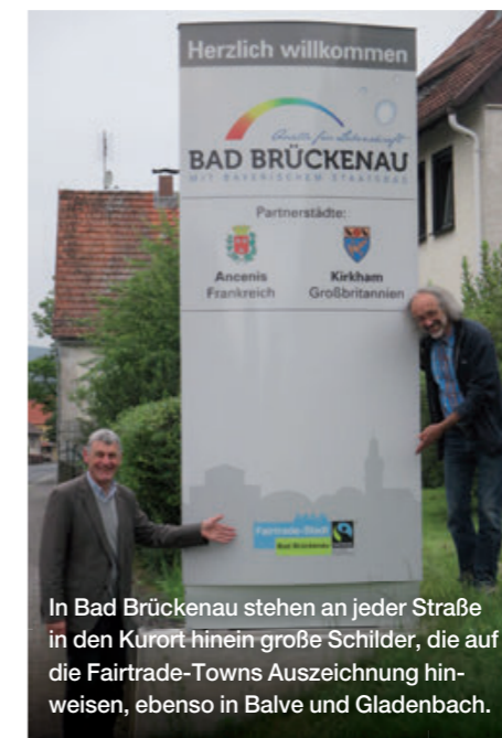
In Bad Brückenau stehen an jeder Straße in den Kurort hinein große Schilder, die auf die Fairtrade-Towns Auszeichnung hinweisen, ebenso in Balve und Gladenbach.

Inspiziert durch das Motto der Fairen Woche „Ich bin Fairer Handel“ organisierte die Fairtrade-Town Lübeck eine Plakataktion mit 24 engagierten Lübecker Persönlichkeiten, die in der ganzen Stadt für den Fairen Handel warben und dafür viel Zustimmung und eine gute Medienresonanz ernteten. Auch Speyer setzte mit 12 lokalen öffentlichen Persönlichkeiten die Poster-Kampagne „Ich bin dabei“ um und warb für den Fairen Handel. In der Fairtrade-Town Bielefeld wurden im Zeitraum der Fairen Woche im gesamten Stadtgebiet 350 Themenplakate rund um den Fairen Handel an Litfaßsäulen und Laternenmasten aufgehängt und in Rostock kamen City Lights zum Einsatz.