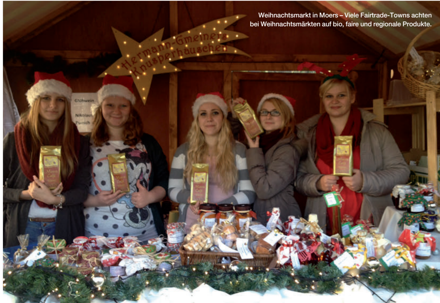
Weihnachtsmarkt in Moers – Viele Fairtrade-Towns achten bei Weihnachtsmärkten auf bio, faire und regionale Produkte.

In lockerer Atmosphäre ins Gespräch kommen und fair gehandelte Produkte zum Probieren oder Verkauf anbieten: Märkte und Stadtfeste bieten viele Gelegenheiten für Stände der Eine-Welt- und Fairtrade-Initiativen, sei es der Gladenbacher Kirschenmarkt, das Fest der Nationen in Berlin-Wilmersdorf, das Maifest „KUNST trifft WEIN“ in Berlin Tempelhof-Schöneberg, der Kunsthandwerker- und der Frühlingmarkt in Schifferstadt, der bio-regional-faire Markt in Sonthofen oder einer der zahlreichen anderen schönen Märkte der Republik.