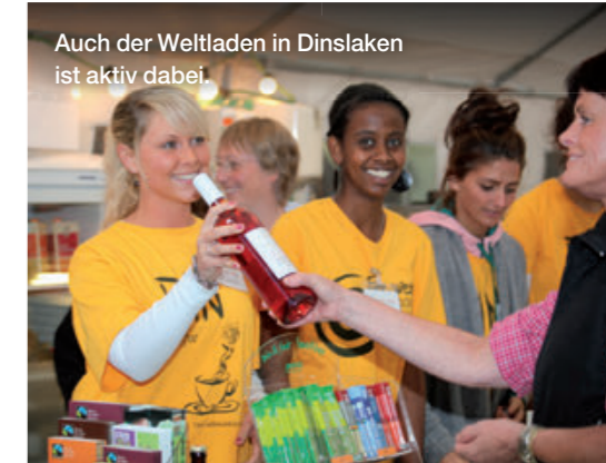
Auch der Weltladen in Dinslaken ist aktiv dabei.

In Dinslaken werden alljährlich rund 300 Repräsentantinnen und Repräsentanten aus Politik und Wirtschaft zum sommerlichen Empfang des Bürgermeisters geladen, bei dem ein Ausblick auf die weitere Stadtentwicklung gegeben wird. Die Gäste wählen neben Produkten der französischen Partnerstadt Agen aus einer bio-regional-fairen Getränkekarte, lernen fair gehandelte Produkte kennen und sollen so zu Multiplikatoren des fairen Genusses in allen Bereichen des Stadtlebens werden.