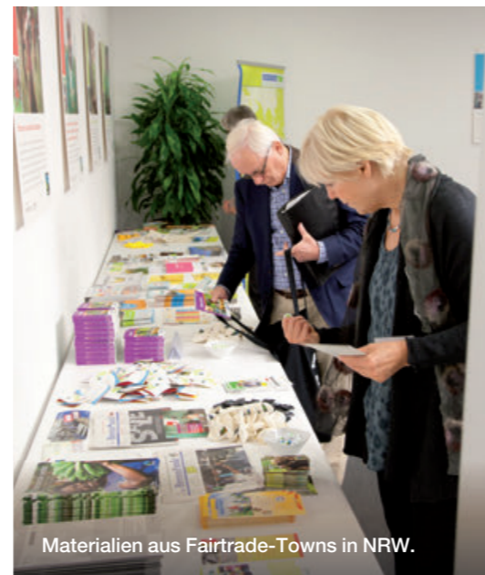
Materialien aus Fairtrade-Towns in NRW.