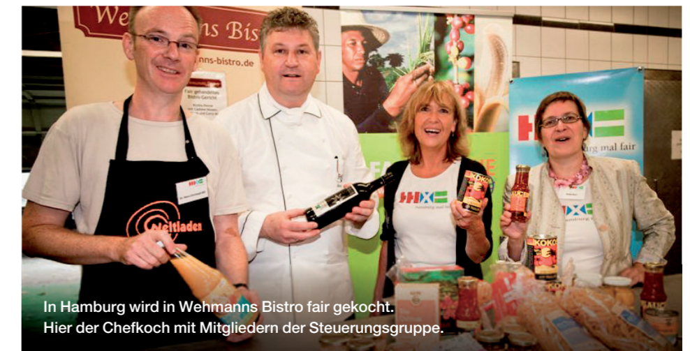
In Hamburg wird in Wehmans Bistro fair gekocht. Hier der Chefkoch mit Mitgliedern der Steuerungsgruppe.