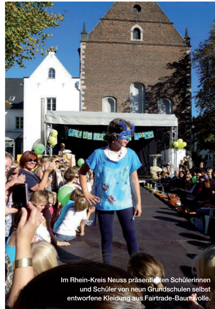
Im Rhein-Kreis Neuss präsentierten Schülerinnen und Schüler von neun Grundschulen selbst entworfene Kleidung aus Fairtrade-Baumwolle.

In einem Pflegeheim im Fairtrade-Stadtbezirk Münster in Stuttgart werden regelmäßig neue Bilder in der Cafeteria aufgehängt. Diese Gelegenheit nutzen die Aktiven für eine Ausstellung rund um den Fairen Handel. Zur Vernissage gab es Kuchen und Getränke aus fair gehandelten Zutaten. Die schönsten Beiträge zur Ausstellung wurden fotografiert und daraus ein Memorie-Kartenspiel erstellt. Die Spiele werden nun als Geschenk im Bezirk angeboten. Auch in der Bezirksbibliothek kann das Memorie ausgeliehen oder vor Ort gespielt werden.