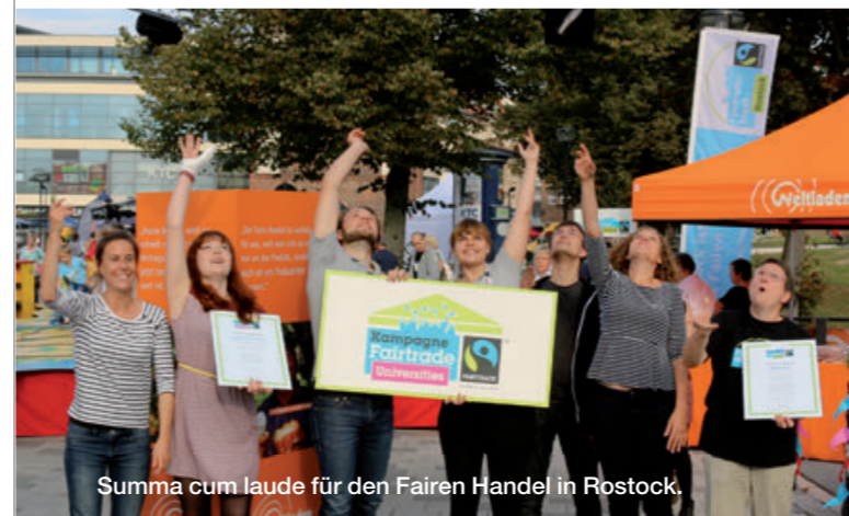
Summa cum laude für den Fairen Handel in Rostock.

Aktive Unterstützung für Fairtrade-Schools im Rhein-Kreis Neuss Der Rhein-Kreis-Neuss unterstützt aktiv Schulen auf dem Weg zur Fairtrade-School. Interessierte Schulen im Kreisgebiet erhalten einen Startzuschuss in Höhe von jeweils 200 Euro sowie Unterstützung für die Öffentlichkeitsarbeit. Darüber hinaus bietet die Neusser-Eine-Welt-Initiative Informationsveranstaltungen für Schulen an. Im Landkreis Neuss erhält das Engagement für Fairen Handel immer wieder neue Impulse durch die bunten Aktivitäten der Jugendlichen.