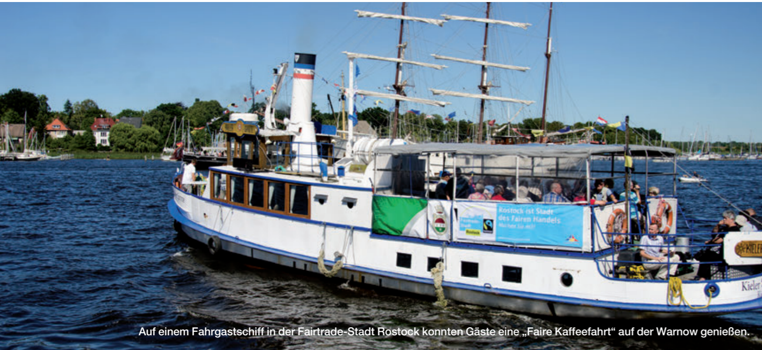
Auf einem Fahrgastschiff in der Fairtrade-Stadt Rostock konnten Gäste eine „Faire Kaffeefahrt“ auf der Warnow genießen.