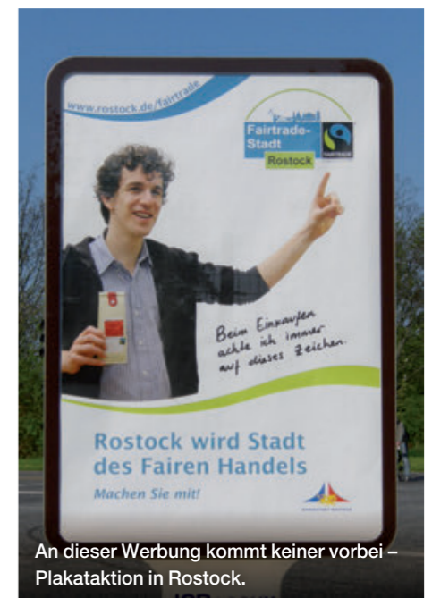
An dieser Werbung kommt keiner vorbei – Plakataktion in Rostock.