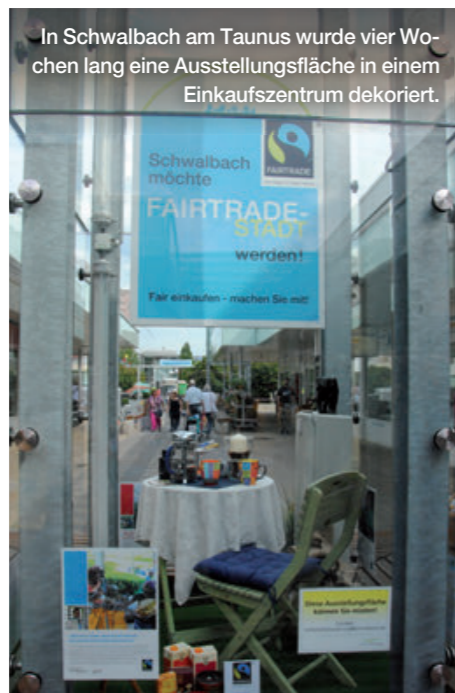
In Schwalbach am Taunus wurde vier Wochen lang eine Ausstellungsfläche in einem Einkaufszentrum dekoriert.

Kronach sagt es sprichwörtlich durch die Blume, dass sich die Stadt für den Fairen Handel engagiert. Vertreterinnen und Vertreter der Fairtrade-Town Kronach und Schülerinnen und Schüler pflanzten gemeinsam das Fairtrade-Logo in gelben, blauen und dunkelvioletten Blumen auf dem Landesgartenschau-Gelände.