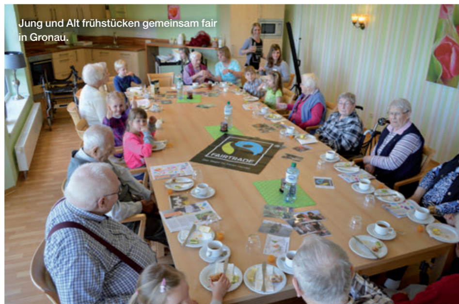
Jung und Alt frühstücken gemeinsam fair in Gronau.

In Heimsheim gestaltete die Fairtrade-Steuerungsgruppe einen gut besuchten Seniorennachmittag unter dem Motto „Gutes aus Nah und Fern“. Fairtrade-Kaffee und Kuchen aus lokalen Zutaten begleiteten eine bebilderte „Weltreise“ zur Herkunft der Produkte. Im Pflegezentrum Münster lud die Steuerungsgruppe zum „Fairtrade-Spielenachmittag“ ein.