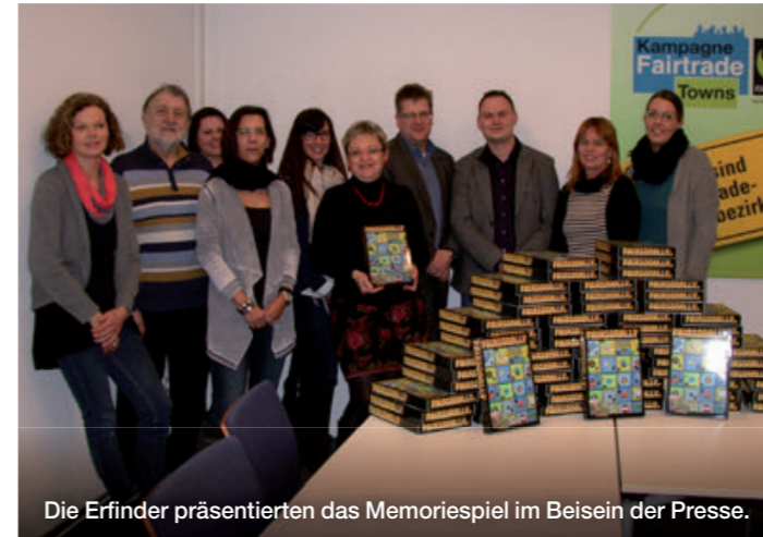
Die Erfinder präsentierten das Memoriespiel im Beisein der Presse.