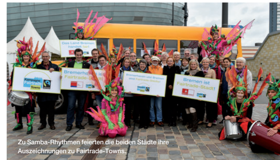
Zu Samba-Rhythmen feierten die beiden Städte ihre Auszeichnungen zu Fairtrade-Towns.

Langeoog, die erste Fairtrade-Insel Deutschlands, nutzte das jährliche Inselanerntreffen der sieben ostfriesischen Inseln, um über ihr Engagement zum Fairen Handel zu informieren. Zudem macht die Insel bei zahlreichen Aktivitäten und schon bei der Überfahrt mit der Fähre jährlich rund 150.000 Touristen auf ihren Titel als Fairtrade-Insel aufmerksam.