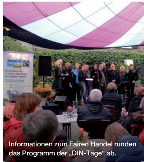
Informationen zum Fairen Handel runden das Programm der „DIN-Tage“ ab.

Im Rahmen des dreitägigen Stadtfestes „DIN-Tage“ findet das faire Kulturcafé statt, das sich aus dem Geburtstagsfest des Agenda 21-Stadtkaffees zu einer festen Größe im Programm entwickelt hat. Zwischen 10.000 und 12.000 Besucherinnen und Besucher erleben mittlerweile jedes Jahr das abwechslungsreiche Kulturprogramm bei Getränken, Kuchen und Imbiss unter dem Motto bio, fair und regional.