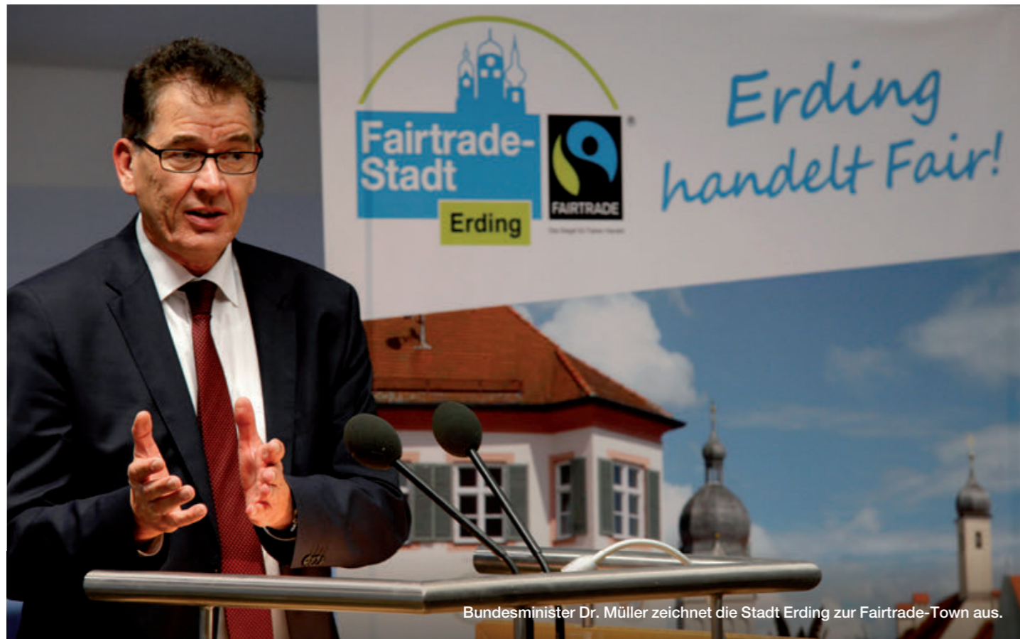
Bundesminister Dr. Müller zeichnet die Stadt Erding zur Fairtrade-Town aus.