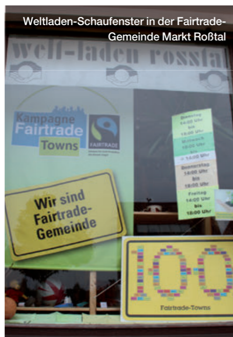
Weltladen-Schaufenster in der Fairtrade-Gemeinde Markt Roßtal