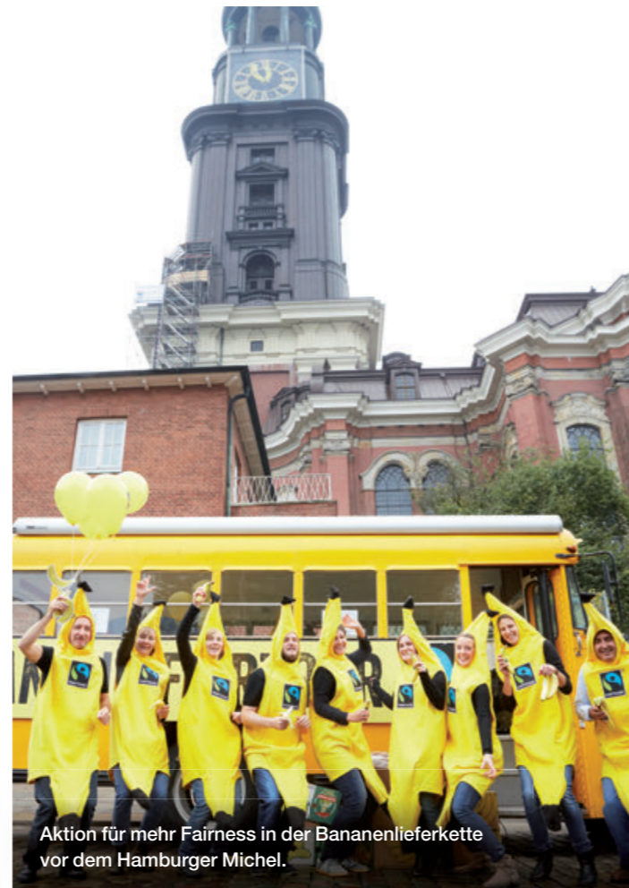
Aktion für mehr Fairness in der Bananenerkette vor dem Hamburger Michel.

In jeder Fairen Woche ruft TransFair e.V. als Highlight an einem Aktionstag zu Veranstaltungen rund um ein Fairtrade-Produkt auf, um so auf die Situation der Produzentinnen und Produzenten im globalen Süden aufmerksam zu machen – in den letzten Jahren gab es Hunderte kreative Veranstaltungen an den „Fairdays“, ein Highlight fand in der Fairtrade-Town Hamburg gemeinsam mit der Steuerungsgruppe statt: „Hamburger Michel schlägt für faire Bananen“ – so lautete die Überschrift zu einer spektakulären Aktion. Um 5 vor 12 stand die Turmuhr des Hamburger Wahrzeichens still. Dann entrollte sich über die Uhr ein großes Banner mit Bananen anstelle der Zeiger und die Botschaft des „Banana Fairdays“ wurde klar: Für die Änderungen im Banan Handel ist es 5 vor 12! Am Fuße des Michels erfuhren Passanten und Interessierte von peruanischen Produzenten aus erster Hand, wie der Faire Handel funktioniert und durften den Geschmackstest machen: Ein gelber Oldtimer-Schulbus versorgte das Publikum mit 2.000 fair gehandelten Bananen.