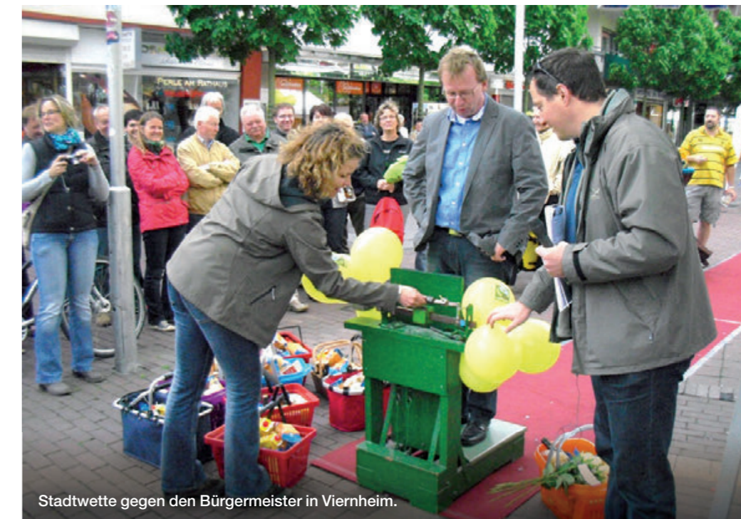
Stadtwette gegen den Bürgermeister in Viernheim.