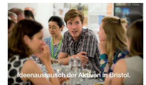
Ideenaustausch der Aktiven in Bristol.