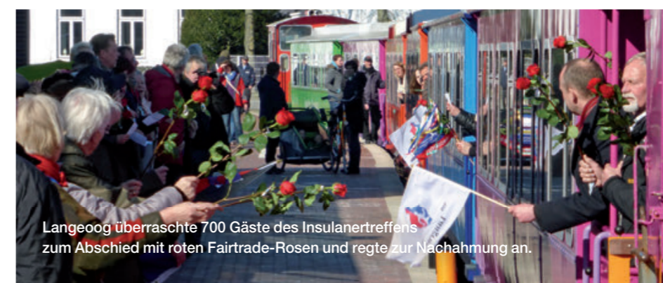
Langeoog überraschte 700 Gäste des Inselanerntreffens zum Abschied mit roten Fairtrade-Rosen und regte zur Nachahmung an.