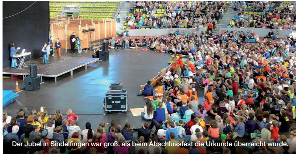
Der Jubel in Sindelfingen war groß, als beim Abschlussfest die Urkunde überreicht wurde.

In den Fairtrade-Towns Amtzell und Gronau lernten die Kleinen jeweils bei einem gesunden Frühstück unter dem Motto „bio-regional-saisonal-fairtrade“ mehr über die Herkunft unserer Lebensmittel. Dazu vermittelten kindgerechte Bildungseinheiten zum Thema Fußbälle und Kleidung weiteres Wissen und Lesungen und Musikveranstaltungen brachten zusätzlichen Spaß. Kinder in Gronau berichteten Bewohnerinnen und Bewohnern einer Senioreneinrichtung über den Fairen Handel und die positiven Auswirkungen.