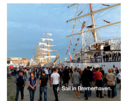
Sail in Bremerhaven.