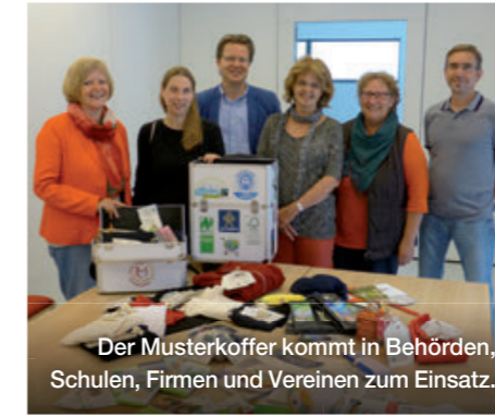
Der Musterkoffer kommt in Behörden, Schulen, Firmen und Vereinen zum Einsatz.

Die Stadt München beschaffte faire Sportbälle für 320 Münchner Schulen. Rund um den Einsatz der Bälle fanden Informationsveranstaltungen und Fachvorträge statt, Fußball-Turniere wurden ausgerichtet, die Bälle wurden bei Events wie dem Streetlife-Festival in München eingesetzt und so einige Aufmerksamkeit für die Idee geschaffen.