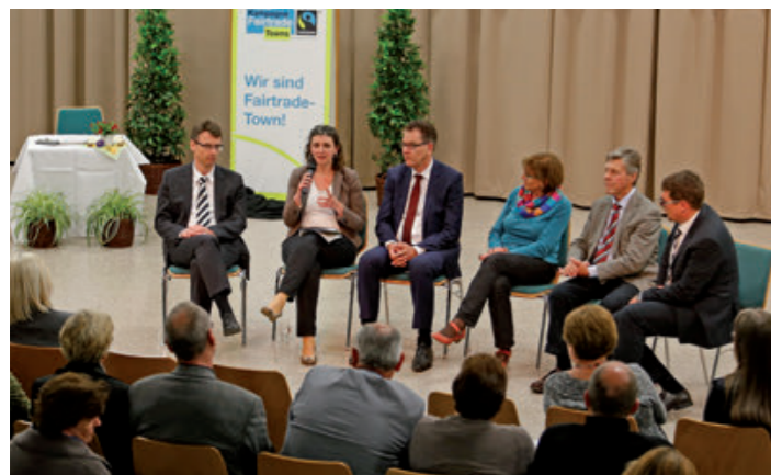
Auszeichnungsfeier der Fairtrade-Stadt Herrieden.

soziale und ökologische Kriterien setzen, haben eine große Vorbildwirkung für die Bürgerinnen und Bürger.“ Zudem startet das BMZ 2016 eine Informationskampagne zum Thema „Faire Beschaffung in Kommunen“, durch die noch mehr Städte und Gemeinden zum Fairen Handeln mobilisiert werden sollen. Darüber hinaus möchte das Bundesministerium kommunale Nord-Süd-Partnerschaften weiter unterstützen. „Von den rund 11.000 Kommunen in Deutschland sind bislang 500 entwicklungspolitisch engagiert. Das können noch mehr werden,“ ermutigt Bundesminister Dr. Müller. Entsprechend gerne hielt er auch in den Städten Herrieden in Oberfranken und Erding in Oberbayern eine Festrede anlässlich der Auszeichnungen als Fairtrade-Towns.