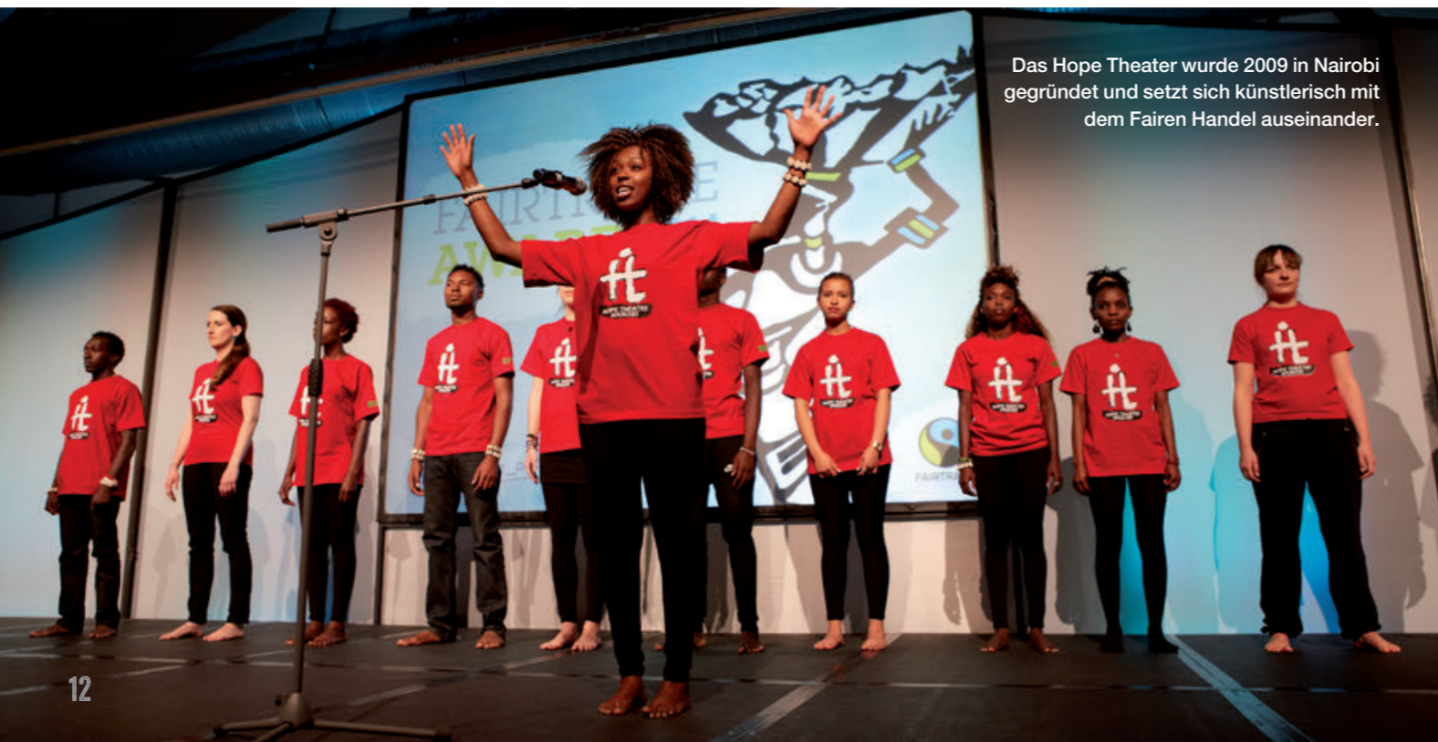
Das Hope Theater wurde 2009 in Nairobi gegründet und setzt sich künstlerisch mit dem Fairen Handel auseinander.

Die gesamte Gemeinde Güntersleben stand im Dienst des Weltladentags. Ein ganztägiges Veranstaltungsprogramm mit einem bunten Mix aus Gottesdienst und Dorfspaziergang zum Thema „Eine-Welt“, ein leckeres Mittagessen mit fair gehandelten Zutaten, Informationen und Filmen über Projekte der Gemeinde, Informationsständen, Kuchenbuffet, Darbietungen des Musikvereins sowie ein Clown luden viele Besucherinnen und Besucher zum Verweilen ein. Der Höhepunkt war die Vorführung des „Hope Theaters“ aus Nairobi.