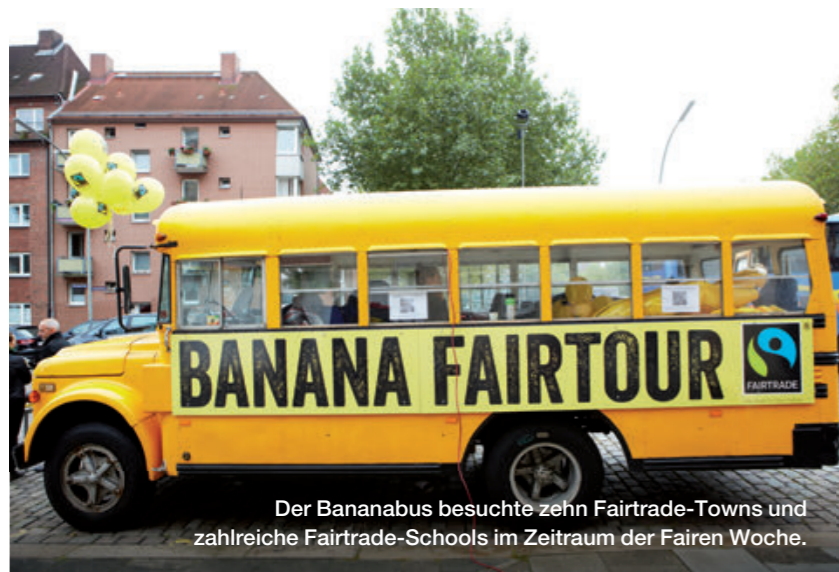
Der Bananabus besuchte zehn Fairtrade-Towns und zahlreiche Fairtrade-Schools im Zeitraum der Fairen Woche.