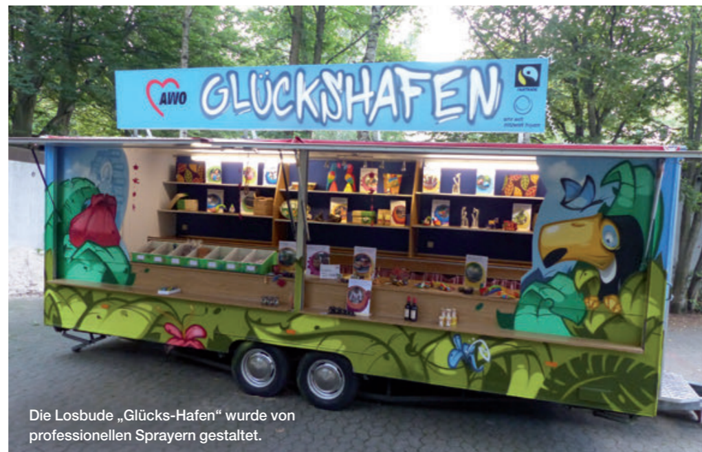
Die Losbude „Glücks-Hafen“ wurde von professionellen Sprayern gestaltet.

verlost seit dem nur noch nachhaltig produzierte Artikel. Neben den fairen Preisen erhalten die glücklichen Gewinner auch Informationen zum Hintergrund der gewonnenen Artikel.