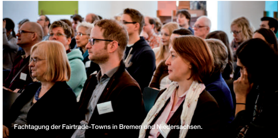
Fachtagung der Fairtrade-Towns in Bremen und Niedersachsen.

Fairtrade-Towns sind das Ergebnis einer erfolgreichen Vernetzung von Personen aus Zivilgesellschaft, Politik und Wirtschaft, die sich für den Fairen Handel in ihrer Heimat stark machen. Sie unterstützen und inspirieren gegenseitig und gemeinsam eine noch stärkere Stimme für den Fairen Handel zu entwickeln ist inzwischen das Ziel vielfältiger Vernetzungsinitiativen zwischen Städten, Regionen und über die Landesgrenzen hinweg.