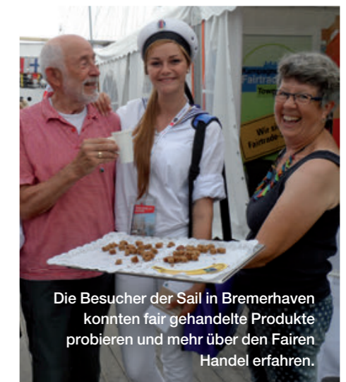
Die Besucher der Sail in Bremerhaven konnten fair gehandelte Produkte probieren und mehr über den Fairen Handel erfahren.