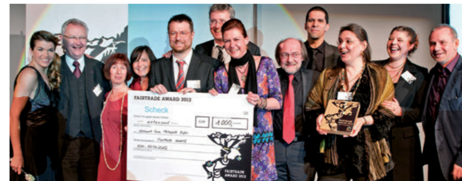
Im März 2012 wurde das Netzwerk Faire Metropole Ruhr für sein Engagement als weltweit erste Fairtrade-Metropole mit dem Fairtrade-Award ausgezeichnet.

Bereits zum neunten Mal traf sich im Juli 2015 die internationale Fairtrade-Towns-Bewegung. Die Konferenz fand unter dem Motto „Mehr Nachhaltigkeit durch Fairen Handel“ in Bristol, Großbritannien – der „Europäischen Grünen Hauptstadt“ 2015 – statt. Über 240 Akteure aus 20 Ländern diskutierten über die neusten Entwicklungen im Fairen Handel sowie ihre Erfahrungen und Ideen rund um die Fairtrade-Towns-Kampagne. Neben Workshops mit praktischen Beispielen zum fairen kommunalen Engagement standen auch die Themen Klimaschutz und nachhaltiger Konsum, sowie die Rolle des Fairen Handels bei den Nachhaltigen Entwicklungszielen (SDGs) der Vereinten Nationen auf der Agenda. Gemeinsam wurde eine Resolution zu mehr Nachhaltigkeit in Kommunen erarbeitet.