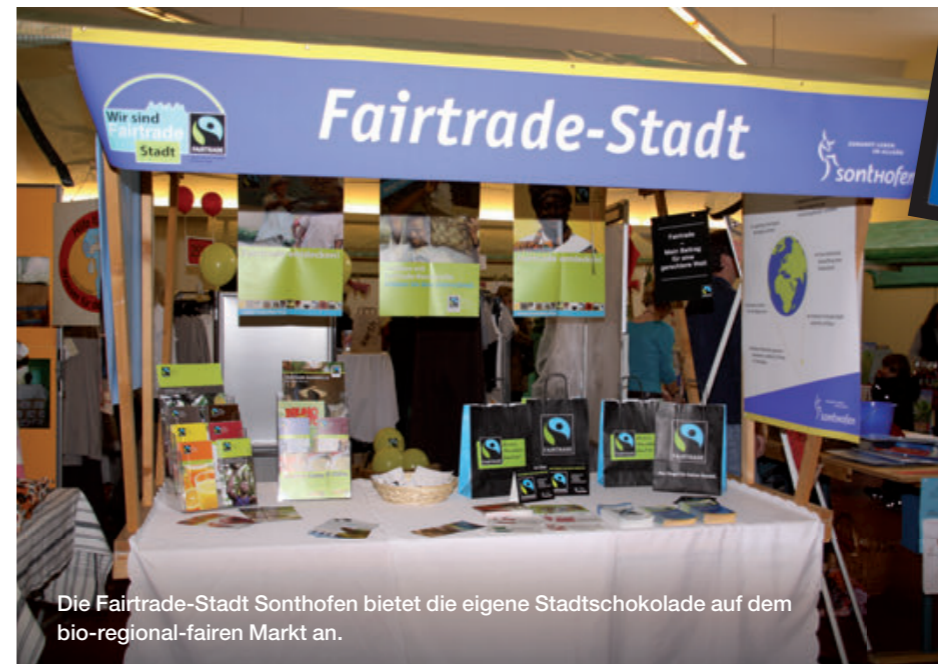
Die Fairtrade-Stadt Sonthofen bietet die eigene Stadtschokolade auf dem bio-regional-fairen Markt an.

Noch eine andere Idee hatte die Stadt Nürnberg mit eigens entworfenen Sattelschonern für Fahrräder, die die Information über die Fairtrade-Town Nürnberg samt Adresse der zugehörigen Internetseite in der ganzen Stadt verbreiten.