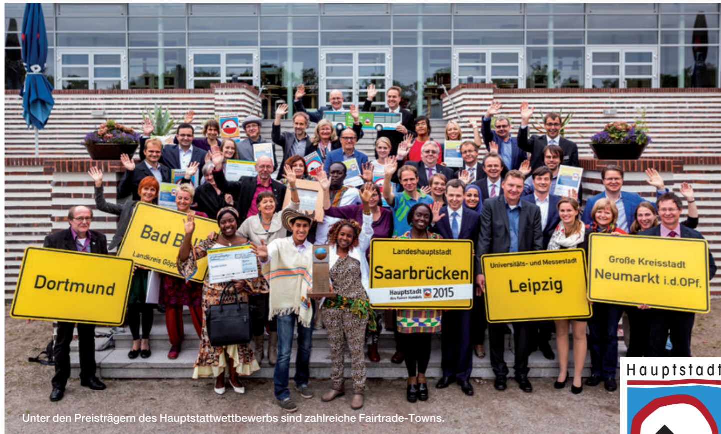
Unter den Preisträgern des Hauptstättwettbewerbs sind zahlreiche Fairtrade-Towns.