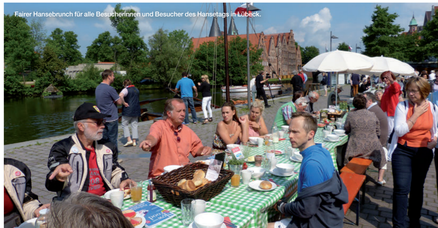
Fairer Hansebrunch für alle Besucherinnen und Besucher des Hansetags in Lübeck.

Die Hansestadt Rostock bewies auch zur „HanseSail“, dass sie die Titel Fairtrade-Town und „Hauptstadt des Fairen Handels 2014“ zu Recht trägt: Das erste reine Segelfrachtschiff der Welt legte mit fair gehandelten Waren am für die Hanse eröffneten Fairtrade-Café an und ein buntes Bühnenprogramm sorgte im Hafenumfeld für Unterhaltung und Informationen. Neben musikalischer Unterhaltung wurden den Gästen Fairtrade-Produkte, wie Kaffee, Tee, Kakao und Eis sowie kleine Snacks angeboten und Informationen rund um das Thema Fairtrade bereitgestellt.