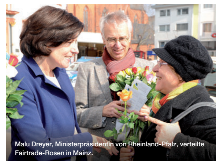
Malu Dreyer, Ministerpräsidentin von Rheinland-Pfalz, verteilte Fairtrade-Rosen in Mainz.

Die Frauenbeauftragte der Stadtverwaltung Eschborn lud gemeinsam mit dem Personalrat alle bei der Stadtverwaltung Eschborn beschäftigten Frauen anlässlich des internationalen Weltfrauentags zu einem kleinen Umtrunk mit fair gehandelten Knabbereien ein. Alle Teilnehmerinnen erhielten als Geschenk eine fair gehandelte Rose sowie Informationen über die Fairtrade-Stadt Eschborn und den fairen Welt-handel.