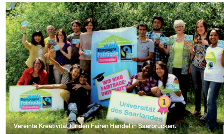
Vereinte Kreativität für den Fairen Handel in Saarbrücken.