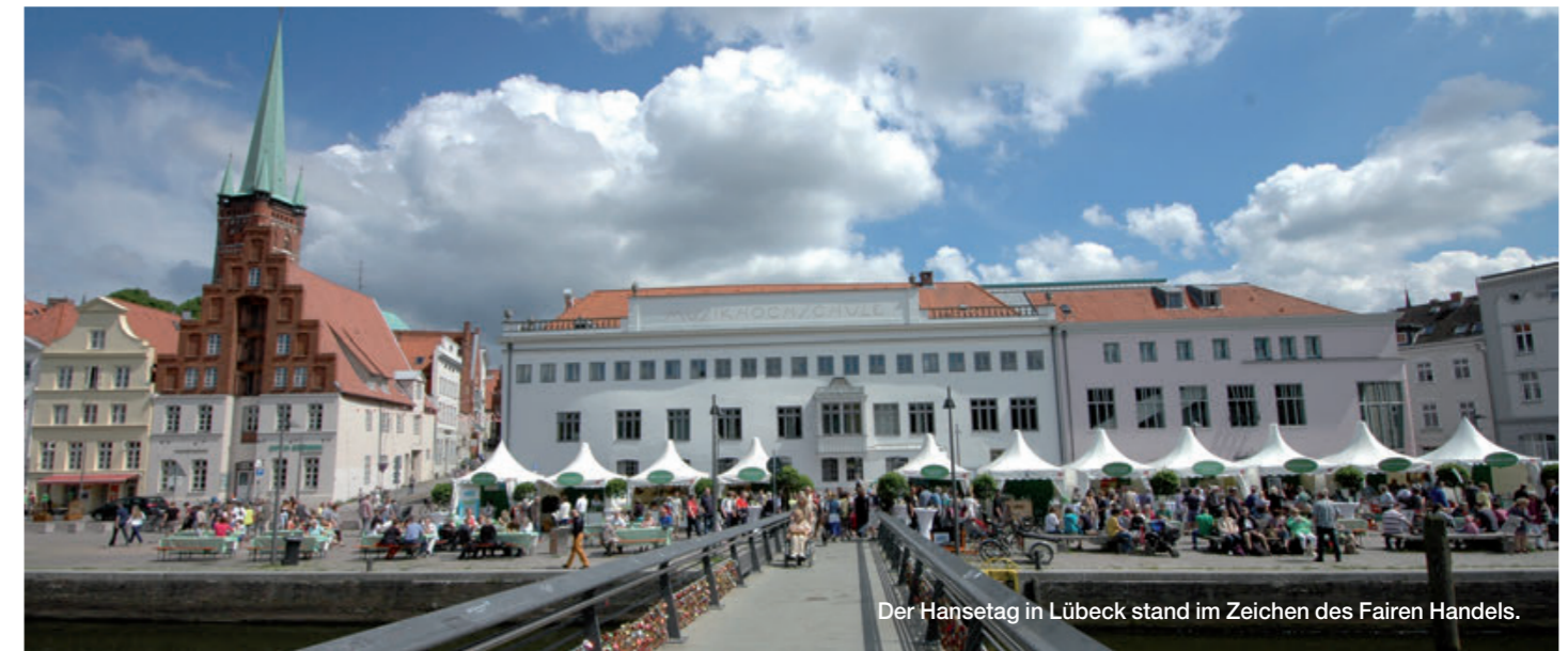
Der Hansetag in Lübeck stand im Zeichen des Fairen Handels.