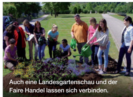
Auch eine Landesgartenschau und der Faire Handel lassen sich verbinden.

Viele Städte machen in ihrer Außenkommunikation auf ihr Engagement aufmerksam. So informiert die Fairtrade-Town Saarbrücken auf den offiziellen Postbriefen der Stadt mit ihrem Fairtrade-Towns Logo über den fairen Titel der Kommune. Die Stadt Bonn nutzt einen eigens entworfenen Stempel, um jedes Jahr auf die Faire Woche und das Veranstaltungsprogramm der Stadt hinzuweisen.