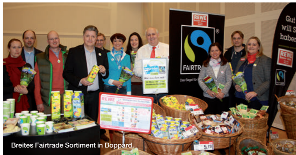
Breites Fairtrade Sortiment in Boppard.

Unter dem Motto „Boppard blüht auf“ gestaltete Boppard einen verkaufsoffenen Sonntag ganz im Zeichen des Fairen Handels mit Unterstützung des ansässigen REWE-Marktes. Neben einer Informationsveranstaltung, einer Ausstellung, Filmen und diversen Ständen lokaler Initiativen schenkte auch der REWE-Marktinhaber an einem Verkostungsstand in der Stadthalle Fairtrade-Saft aus und präsentierte die im Markt erhältlichen Fairtrade-Produkte. Außerdem gab es Sonderangebote zu elf Fairtrade-Produkten und einen fairen