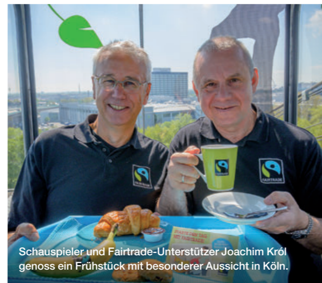
Schauspieler und Fairtrade-Unterstützer Joachim Kröl genoss ein Frühstück mit besonderer Aussicht in Köln.