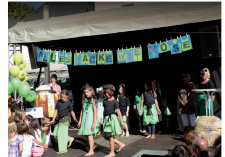
Eine bunte Modenschau organisierte die Fairtrade-Town Salzhausen.

Ebenfalls um die Textilproduktion ging es bei der Ausstellung „Trikot-Tausch – Die zwei Seiten der internationalen Sportbekleidungsproduktion“ des Vereins Vamos e.V. aus Münster, die in Rheda-Wiedenbrück gezeigt und dort von Vorträgen, einem Nähkurs und einer Schulaktion begleitet wurde. Schülerinnen und Schüler mehrerer Schulen erhielten weiße T-Shirts aus Fairtrade-Baumwolle zum Gestalten und präsentierten die Ergebnisse im Rahmen der Ausstellung.