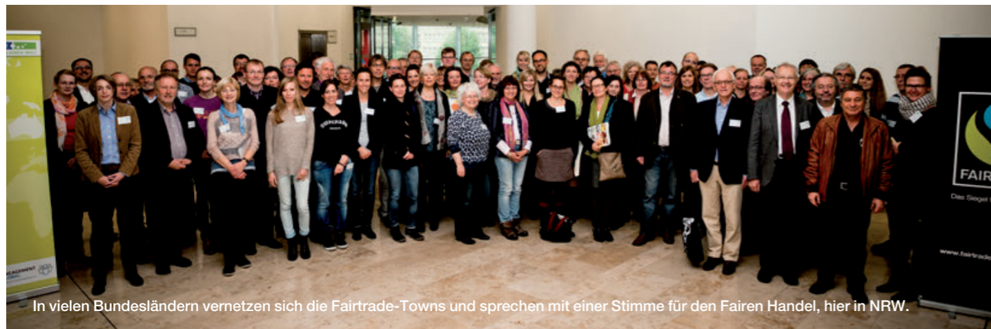
In vielen Bundesländern vernetzen sich die Fairtrade-Towns und sprechen mit einer Stimme für den Fairen Handel, hier in NRW.