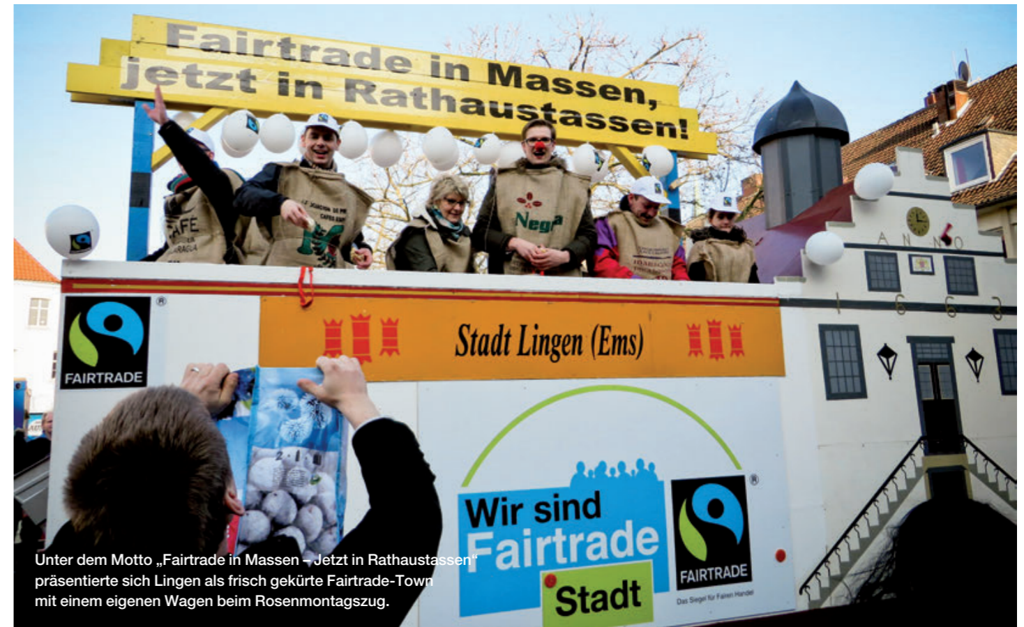
Unter dem Motto „Fairtrade in Massen – Jetzt in Rathausstassen“ präsentierte sich Lingen als frisch gekürte Fairtrade-Town mit einem eigenen Wagen beim Rosenmontagszug.