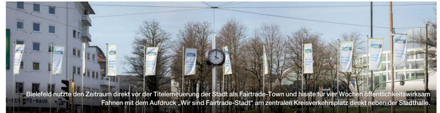
Bielefeld nutzte den Zeitraum direkt vor der Titelerneuerung der Stadt als Fairtrade-Town und hisste für vier Wochen öffentlichkeitswirksam Fahnen mit dem Aufdruck „Wir sind Fairtrade-Stadt“ am zentralen Kreisverkehrsplatz direkt neben der Stadthalle.