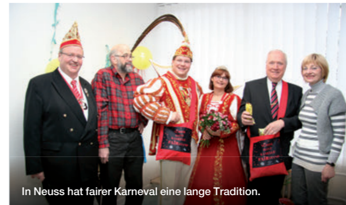
In Neuss hat fairer Karneval eine lange Tradition.

Die Neusser Eine Welt Initiative (NEW!) lud das Neusser Prinzenpaar nebst Gefolge zu einem närrisch-fairen Frühstück ein. Dabei wurde dem Prinzenpaar der originelle Neusser Faire-Kamelle-Beutel überreicht und das Prinzenpaar so zu Botschaftern des Fairen Handels.