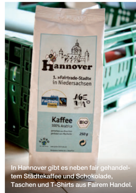
In Hannover gibt es neben fair gehandeltem Städtekaffee und Schokolade, Taschen und T-Shirts aus Fairem Handel.

Die Kampagne Fairtrade-Towns beflügelt auch den direkten Austausch mit den Ländern des Südens. Viele deutsche Kommunen pflegen intensive Städtepartnerschaften mit Kommunen in Asien, Afrika und Lateinamerika und der Faire Handel ist hier zunehmend Thema. Ein schönes Beispiel ist die Stadt Hannover, die intensiv mit ihrer Partnerstadt Blantyre in Malawi zusammenarbeitet und ebenso eine Klimapartnerschaft mit Belém de los Andaquíes in Kolumbien eingegangen ist. Als süßes Produkt ist hierbei die faire