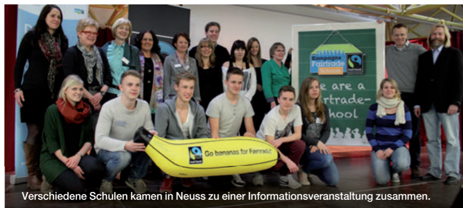
Verschiedene Schulen kamen in Neuss zu einer Informationsveranstaltung zusammen.

bessere Welt einsetzen. Mit dem Titel "Fairtrade-School" können sie ihr Engagement nach außen tragen. Die Kampagne bietet eine Fülle von Hintergrundinformationen und Materialien zum Fairen Handel sowie Schulbesuche vor Ort durch geschulte Referentinnen und Referenten an. Einige Fairtrade-Towns unterstützen gezielt die Bewerbung von Schulen in ihrem Stadtgebiet, in anderen Städten sind engagierte Schulen treibende Kräfte hinter der Fairtrade-Towns-Bewerbung ihrer Stadt oder Gemeinde. Darüber hinaus lassen sich viele Aktivitäten gemeinsam durchführen und Synergien können genutzt werden. www.fairtrade-schools.de