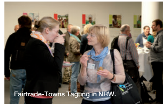
Fairtrade-Towns Tagung in NRW.