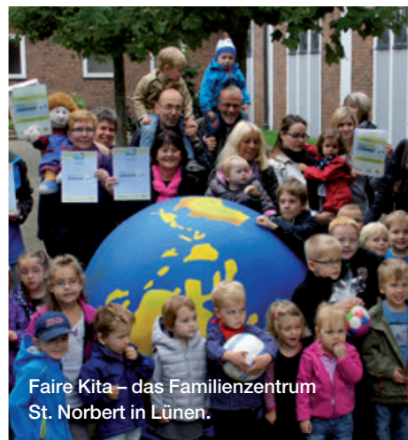
Faire Kita – das Familienzentrum St. Norbert in Lünen.

Das Netzwerk Faire Metropole Ruhr bietet seit Oktober 2013 das Projekt FaireKITA für Kindertageseinrichtungen in Nordrhein-Westfalen unter Federführung des Informationszentrum 3.Welt Dortmund e.V. an. Auf dem Weg zur Auszeichnung erhalten Kitas von der Projektstelle Unterstützung und Beratung zu Bildungsmaterialien, bei der Öffentlichkeitsarbeit und für Informations- und Austauschveranstaltungen. Bereits rund 40 Einrichtungen wurden ausgezeichnet, weitere hundert haben sich in NRW auf den Weg gemacht.