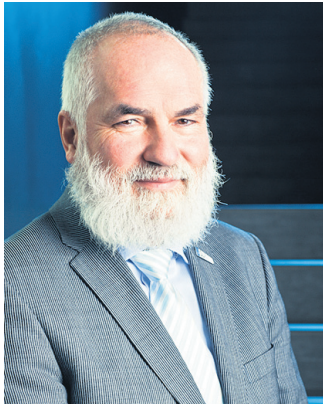
Liebe Saalfelderinnen und Saalfelder, liebe Freunde unserer Stadt, verehrte Gäste,

Weihnachten! Was ist eigentlich Weihnachten? Weihnachten heißt auch: Die Familie steht mehr als sonst im Jahr im Mittelpunkt, kulinarische Genüsse, Geschenke und Kerzen. Jede Menge Weihnachtsfeiern finden statt und gelegentlich gibt es Streit. Ist das tatsächlich alles oder ist da doch mehr? Im letzten Jahr besagte eine „Stern“-Umfrage, dass jeder Zehnte die ursprüngliche Bedeutung von Weihnachten nicht mehr kennt.