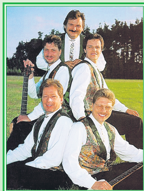
Änderungen vorbehalten - Eintritt frei.

Die professionelle Show- und Tanzkapelle wird den musikalischen Rahmen der Saalfelder „Nacht des Schlagers“ setzen. Die Band präsentiert ein breitgefächertes musikalisches Repertoire mit Schlagern, Oldies & Evergreens, aktuellen Songs und Stimmungshits. Die Vollblutmusiker lassen jede Veranstaltung zu einem Highlight werden.